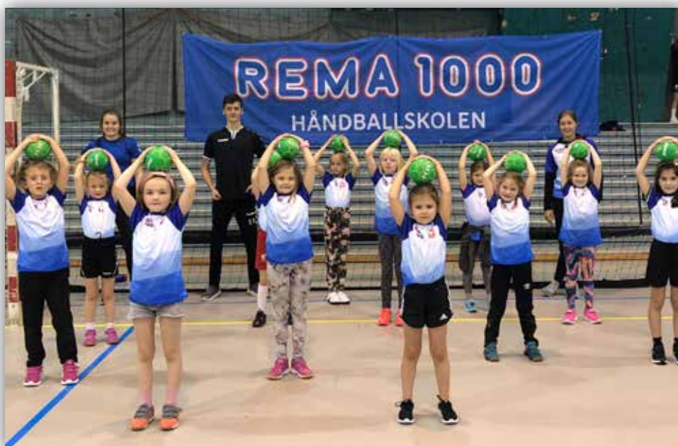
Ein herleg kohort handballspelarar frå haustens korona-tilpassa handballskule.