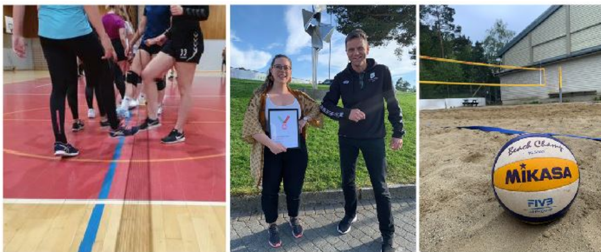
Fra venstre: Trening i 2020, Stord volleyball mottok støtte fra Sparebank Vest, dugnad på sandvolleyball banen.

Året 2020 har vært prega av omstilling og uten moglegheit for langtidsplanlegging. Det har vært ei utfordring for alle å tilpasse seg situasjonen gjennom 2020. Styret er imponert over omstillingsevnen, engasjement og stå-på-viljen til alle i klubben, både spelarar, trenarar, foreldre, lagleiarar og styret.