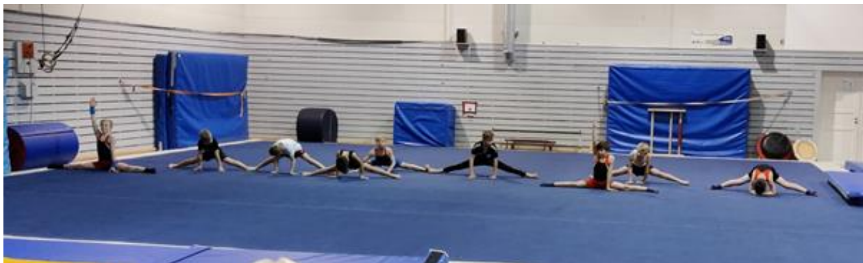
(Bilete frå juleoppvisninga 2020)

Me arrangerte eigen juleframsyning med satsingsparti og nybyrjarpartiet før jul. Dette var stor suksess! Berre foreldre og nær familie var i publikum, og me fekk vist fram mykje av kva med driv med på trening.