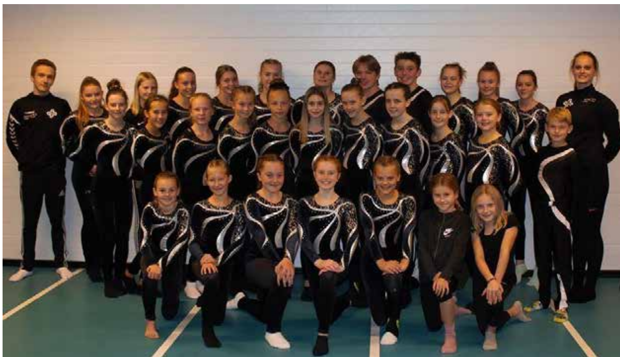
(Lagbilette Stord troppsgymnastikk nov-2019)

Trenarstaben har delt på oppgåvene på ein god måte, og med ei positiv haldning til nye utfordringar, er det mogleg for turngruppa å halde på tilbodet om troppsgymnastikk i åra framover.