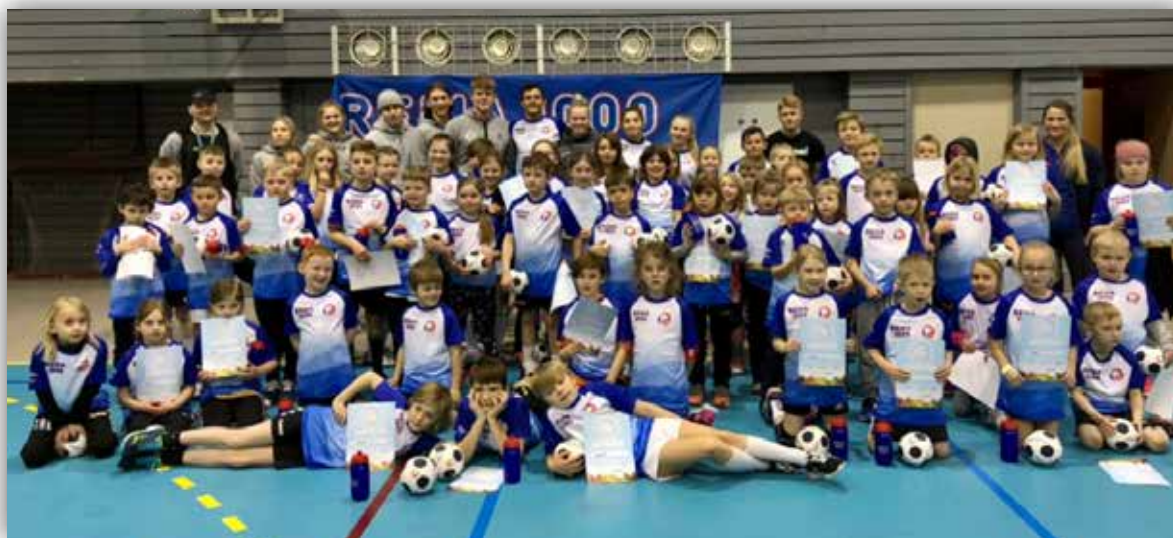
Ein herleg bukett handballspelarar frå handballskulen våren 2020, før korona.